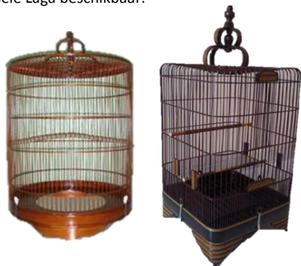
Het type gevraagde kooien (rond of vierkant)