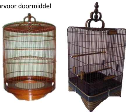
Het type gevraagde kooien (rond of vierkant)